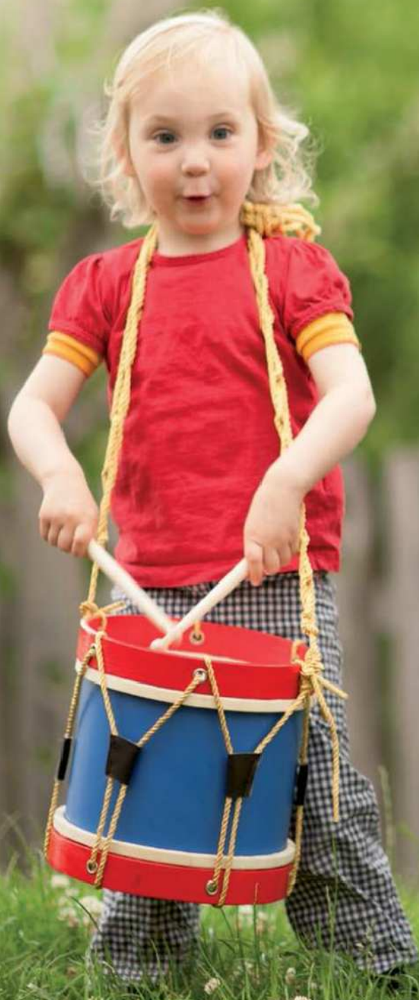
2016 Tamburo «Banda musicale» - pag. 237