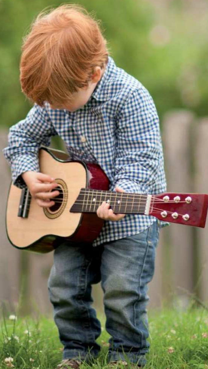
3307 Chitarra «Natura» - pag. 235